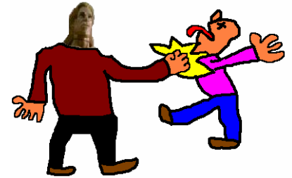
Leif-Runar delar ut smällar

Här kommer några bilder från förra sommaren. Nästa år kommer bilder från den här sommaren.