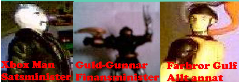
Xbox Man Satsminister