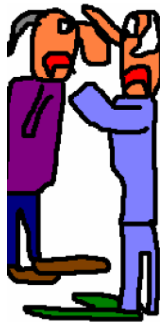
Vänster: Järnhår. Höger: Plasthår.