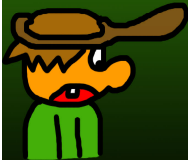
KUNG KOLANAPP - PARTILEDARE